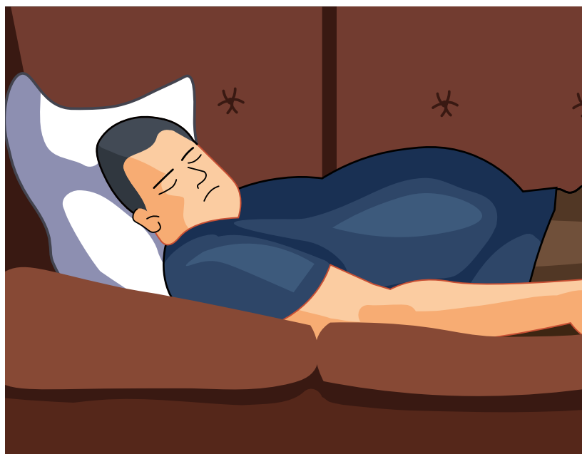
МАЛОПОДВИЖНЫЙ ОБРАЗ ЖИЗНИ