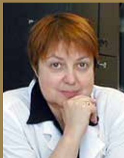
МЕЛЬНИЧЕНКО ГАЛИНА АФАНАСЬЕВНА

Академик РАН, директор ФГБУ «Эндокринологический научный центр» Минздрава России, Президент общественной организации «Российская ассоциация эндокринологов», главный внештатный специалист эндокринолог Минздрава России