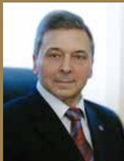
ДЕДОВ ИВАН ИВАНОВИЧ

Академик РАН, директор ФГБУ «Эндокринологический научный центр» Минздрава России, Президент общественной организации «Российская ассоциация эндокринологов», главный внештатный специалист эндокринолог Минздрава России