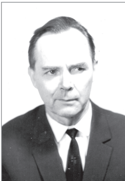
Академик АМН СССР Юдаев Николай Алексеевич (1913–1983)