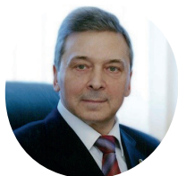
Дедов Иван Иванович

Президент общественной организации «Российская ассоциация эндокринологов», Президент ГНЦ РФ ФГБУ «НМИЦ эндокринологии» Минздрава России, главный внештатный специалист эндокринолог Минздрава России, академик РАН, д.м.н., профессор.