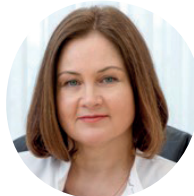
Мокрышева Наталья Георгиевна

Президент общественной организации «Российская ассоциация эндокринологов», Президент ГНЦ РФ ФГБУ «НМИЦ эндокринологии» Минздрава России, главный внештатный специалист эндокринолог Минздрава России, академик РАН, д.м.н., профессор.