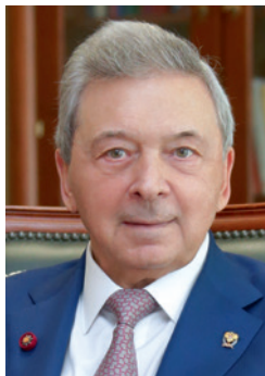
ДЕДОВ ИВАН ИВАНОВИЧ

Президент общественной организации «Российской ассоциации эндокринологов», Президент ФГБУ «НМИЦ эндокринологии» Минздрава России, Главный внештатный специалист-эндокринолог Минздрава России Академик РАН