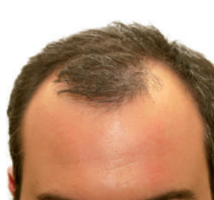
Алоpecia у мужчин

эндокринолога, гастроэнтеролога, гинеколога, диетолога, андролога, иммунолога и др.