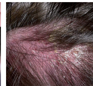
Воспалительные заболевания кожи головы