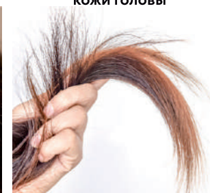
Ухудшение качества волос