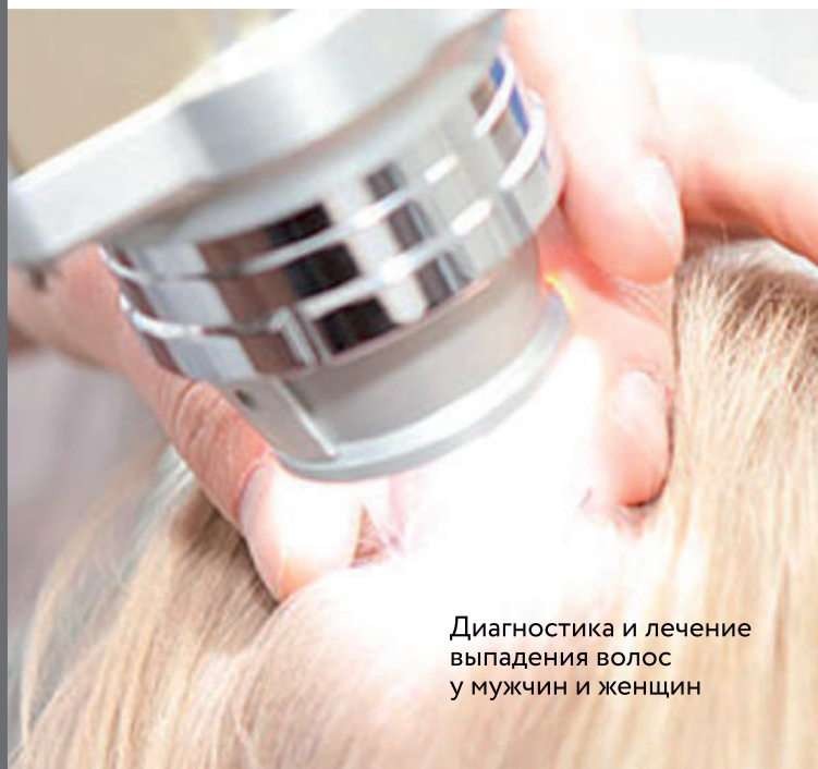
Диагностика и лечение выпадения волос у мужчин и женщин