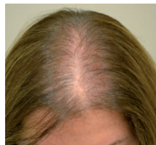
Алоpecia у женщин